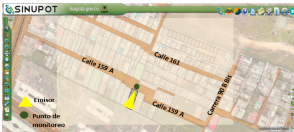
Figura 1. Ubicación del predio emisor y punto de monitoreo.